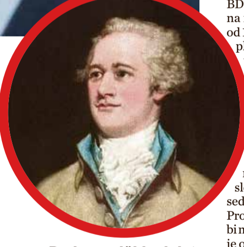
Prvi američki ministar financija Alexander Hamilton projektirao je protekcionizam