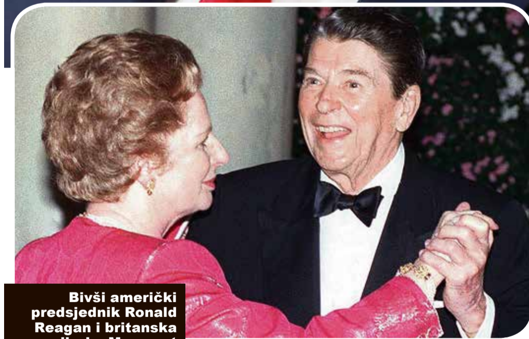
Bivši američki predsjednik Ronald Reagan i britanska premijerka Margaret Thatcher pokrenuli su proces globalizacije

Uvijek sam se zalagao za razvoj znanosti i obrazovanja. Nisam prihvaćao niti prihvaćam znanost i obrazovanje kao ukras. Znanost i obrazovanje moraju biti lokomotiva našeg ukupnog razvoja. Ivan Supek jasno je precizirao znanost kao temeljnu polugu razvoja. Nije se samo on zalagao za drugi i drugačiji pristup. Katastrofičari su se također zalagali da putem znanosti i obrazovanja ostvarimo nacionalni suverenitet. Na našem novom ministru znanosti i obrazovanja gospodinu Radovanu Fuchsu je da pokrene nove i drugačije procese koji će biti katalizator uspostave nacionalnog suvereniteta. Bilo bi krasi kada bi premijer Plenković najveću moguću pažnju posvetio novom i drugačijem pristupu znanosti i obrazovanju. Tako bismo konačno mogli postati suverena zemlja. ■