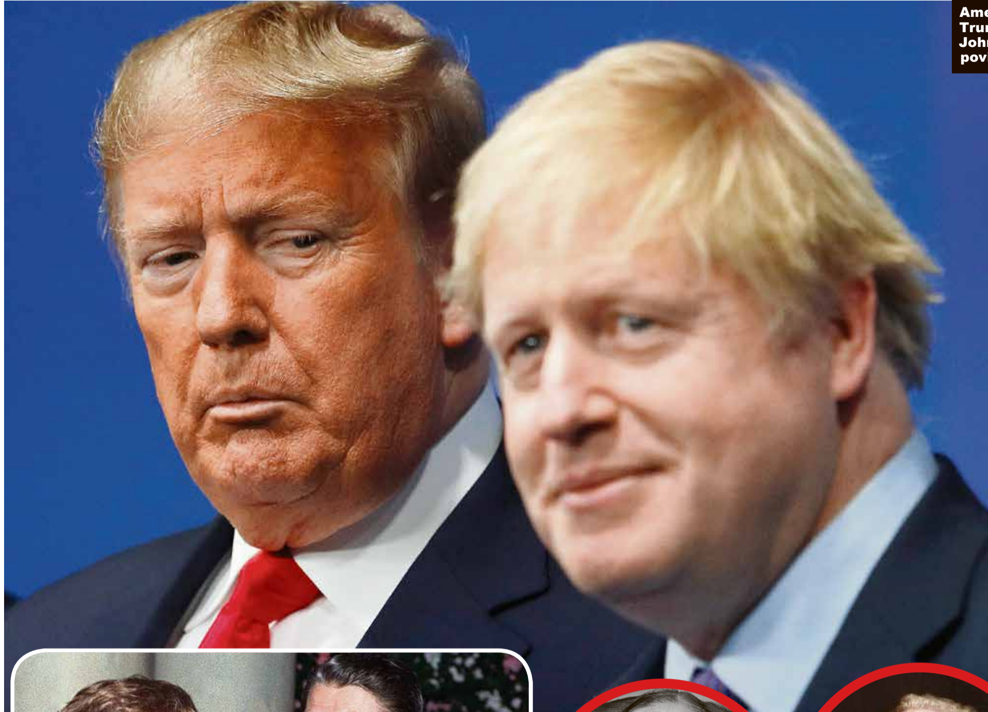
Američki predsjednik Donald Trump i britanski premijer Johnson pokušali su kotać povijesti okrenuti unatrag

Slijedi zaključak kako je teško govoriti o modernom suverenitetu u manje razvijenim zemljama. Suverenitet pretpostavlja konkurentnost, što je moguće ostvariti